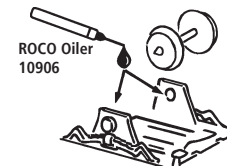
ROCO Oiler 10906

Les pièces de finition illustrées sont à monter par le modéliste. Le jeu de pièces peut comprendre d'autres pièces (non illustrées) qui sont destinées à autres versions du modèle et qui sont superflus à la variante présente.